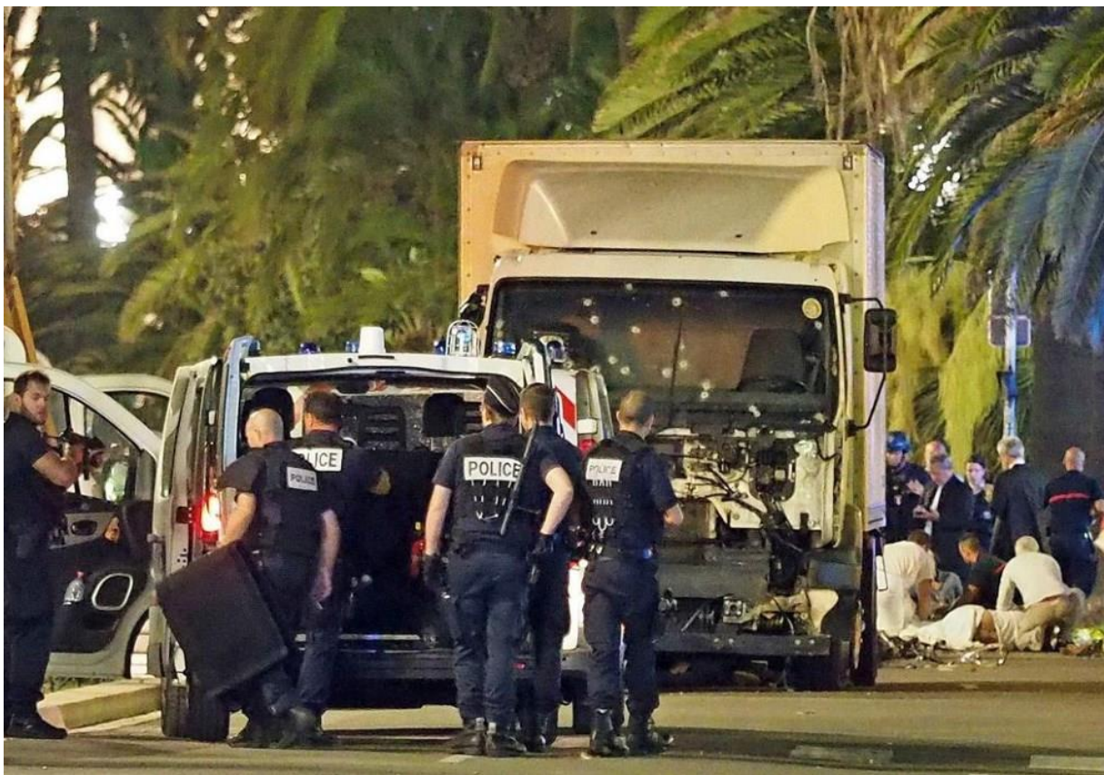
Een derde van de slachtoffers in Nice was moslim. Volgens experts doet elke moslimdode bij aanslagen de populariteit van IS dalen.

De jongeren die in naam van Islamitische Staat aanslagen plegen in Europa, worden niet gedreven door godsdienst of politiek. Programma's voor deradicalisering zijn dan ook zinloos, zegt de Gentse hoogleraar Rik Coolsaet.