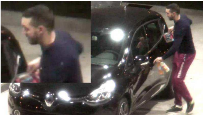
Mohamed Abrini, toujours activement recherché.

Le même jour, trois individus sont privés de liberté à l'issue de perquisitions menées à Bruxelles, Malines et Duffel et inculpés de participation aux activités terroristes dans un dossier connexe à celui des attentats. Ils appartiendraient, selon certaines sources, au cercle de connaissances des frères El Bakraoui. On n'en sait pas plus.