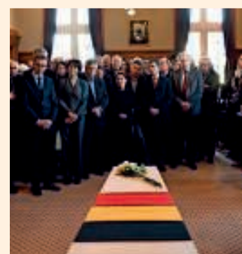
Des centaines de personnes se sont recueillies, vendredi, à Edegem devant la dépouille de l'ancien Premier ministre Leo Tindemans.