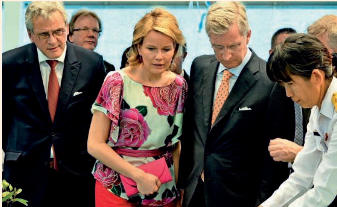
Les missions princières, comme celle au Vietnam en 2012, ont régulièrement suscité des frictions avec les Régions.

Alors que la Belgique perd des parts de marché dans le monde, la diplomatie économique gagnerait à une meilleure collaboration entre le Fédéral et les Régions.