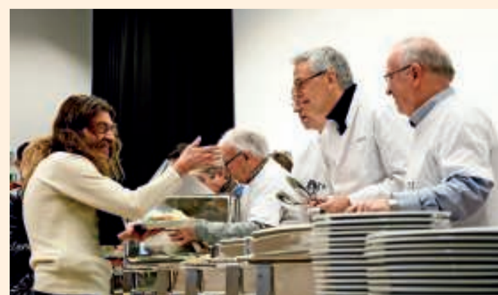
Le vice-Premier ministre Kris Peeters et l'ancien ministre-président flamand Luc Van den Brande ont servi vendredi à Malines des repas pour les défavorisés.