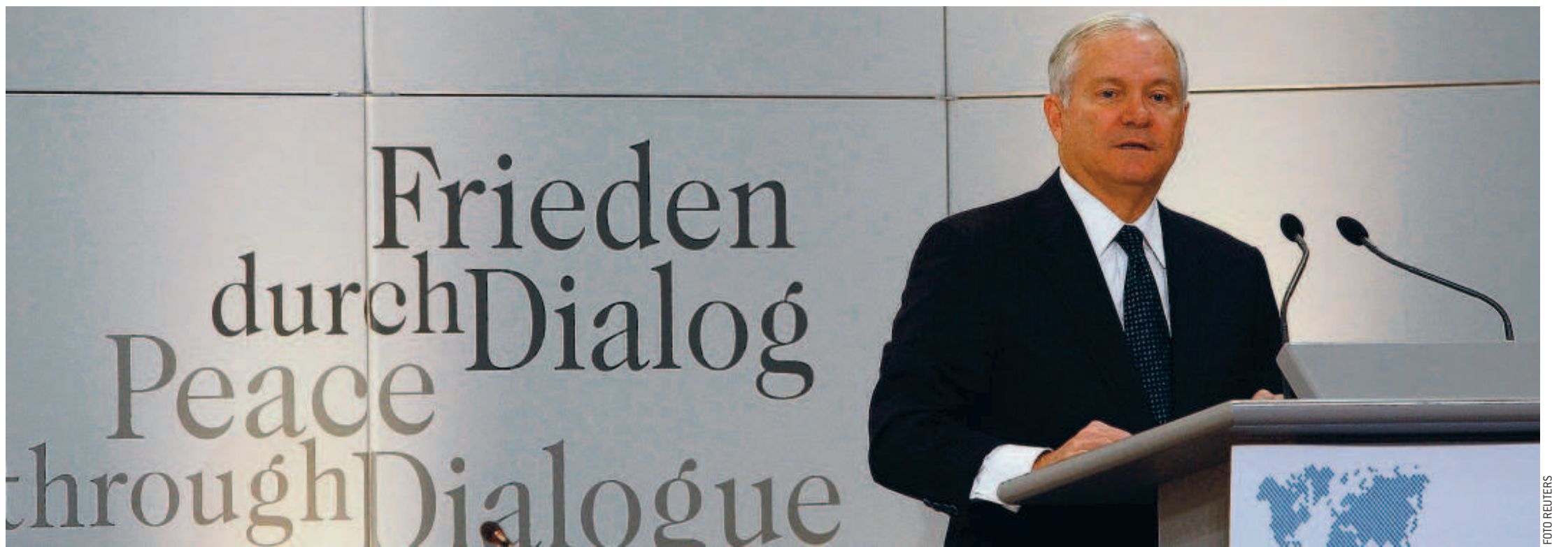
■ Robert Gates, Amerikaans minister van Defensie: 'De NAVO moet opletten dat het geen bondgenootschap op twee sporen wordt.'

Als de Europese landen geen extra troepen naar Afghanistan sturen, dan komt zowel de toekomst van de NAVO als de veiligheid van de Europese bevolking in gevaar. Met die woorden zet Robert Gates, Amerikaans minister van Defensie, de sluimerende spanningen binnen het bondgenootschap op scherp.