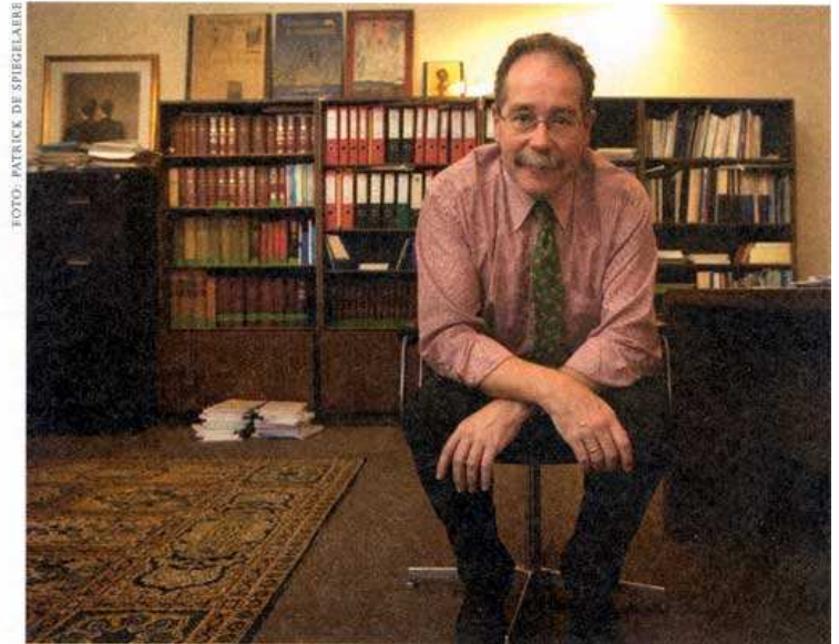
'In het internationale wereldje is het Frans al lang niet meer de voertaal, maar wel het Engels'

Als ik Coolsaet nadien vraag of deze internationale erkenning Brussel (met de Vlaamse rand) en België alleen maar baten bijbrengt, en daarbij het woord 'terrorisme' laat vallen, krijg ik van de professor een boze blik. 'Wie denkt dat Brussel ooit het doelwit zou worden van een of andere grote bom is ongelooflijk dom', zegt Coolsaet. 'Dat betekent niet dat wij vrij zijn van bedreigingen, maar die zullen eerder